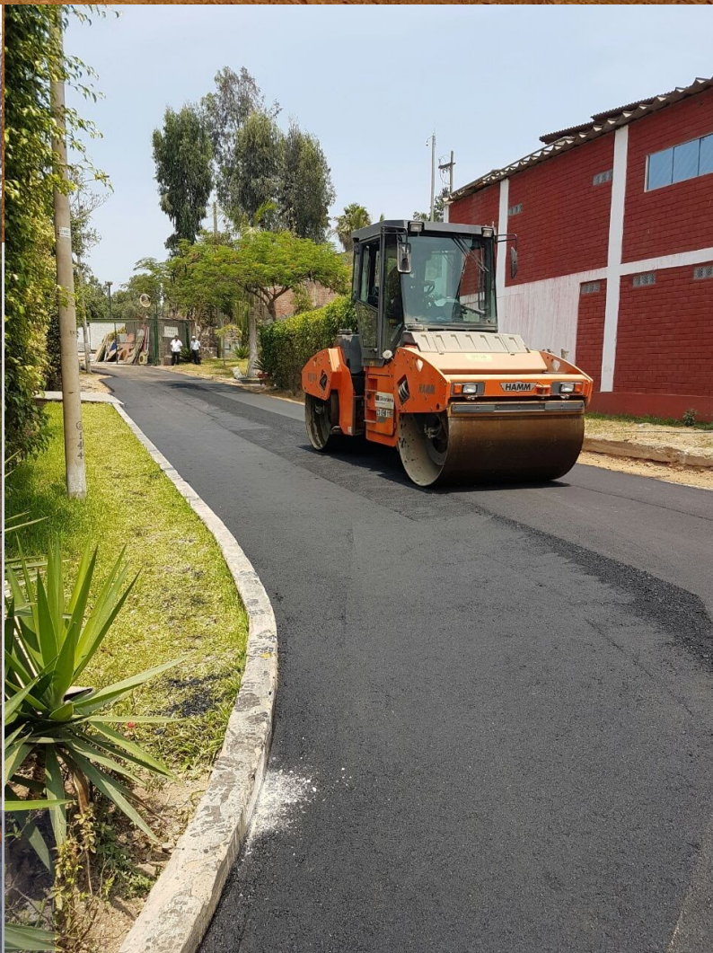
PISTAS Y VEREDAS AULAS NEWTON LA MOLINA—LMA